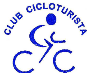
CABANILLAS DEL CAMPO C.I.F.: G-19185677